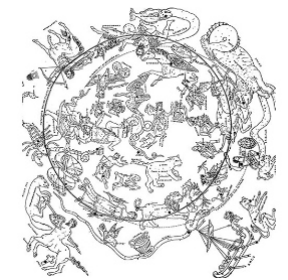
Zie bijbelstudie nr. 21: "Christus in de sterren".

Het hele verhaal van de Argonauten is een verbastering van de oude overlevering, vanaf Adam, omtrent Christus, omtrent de Verlosser, Die komen zou. De plaatjes daarvan vinden we aan de sterrenhemel, d.w.z. de klassieke sterrenkaart, die van Dendra. Daar komen we inderdaad de tweelingen ook tegen. Het is een van de tekens van de dierenriem zelfs. Een van de twaalf tekens van de dierenriem. De tweelingen. De "Argos" komen we ook tegen. Het hoort niet bij de dierenriem, maar is er, zoals alle beelden, aan gerelateerd. Het grote schip helemaal in het zuiden ergens.