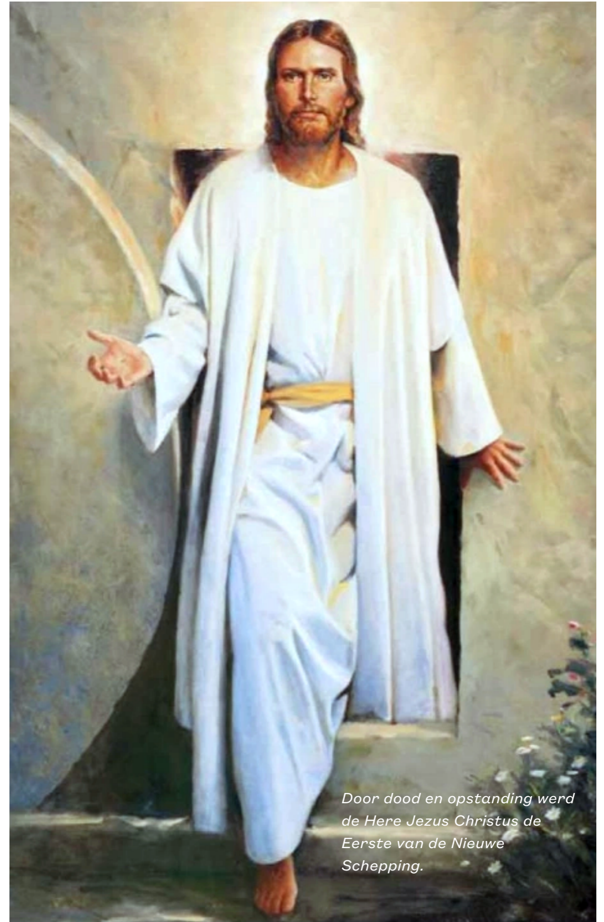
Door dood en opstanding werd de Here Jezus Christus de Eerste van de Nieuwe Schepping.

Zijn opstanding op "de derde dag" werd niet de opstanding van Juda op diezelfde derde dag. Maar zo'n opstanding na twee dagen (van 1000 jaar; 2 Petrus 3 : 8) staat wel degelijk in Gods Plan. En dat wordt ook uitgedrukt in het "teken van Jona", dat daarmee niet beperkt bleef tot alleen het teken van de dood en opstanding van de Here Jezus.