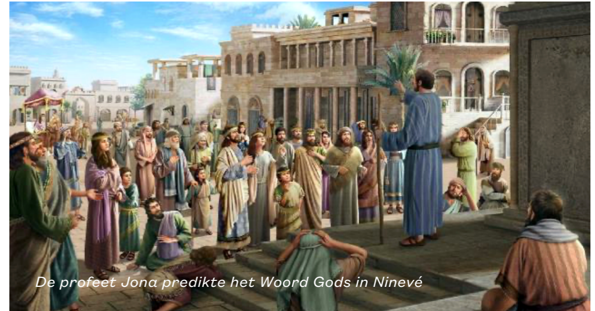
De profeet Jona predikte het Woord Gods in Ninevé

De prediking van Jona leidde lang geleden tot de omkeer (de bekering) van de inwoners van Ninevé. Zij " geloofden aan God ". Daarmee voorkwam men dat "men verloren ging" in het oordeel, zoals dat aangekondigd was. Alleen al de optekening van deze geschiedenis zou in deze tijd toch een teken voor "de wereld", en voor elk mens, moeten zijn om na te volgen.