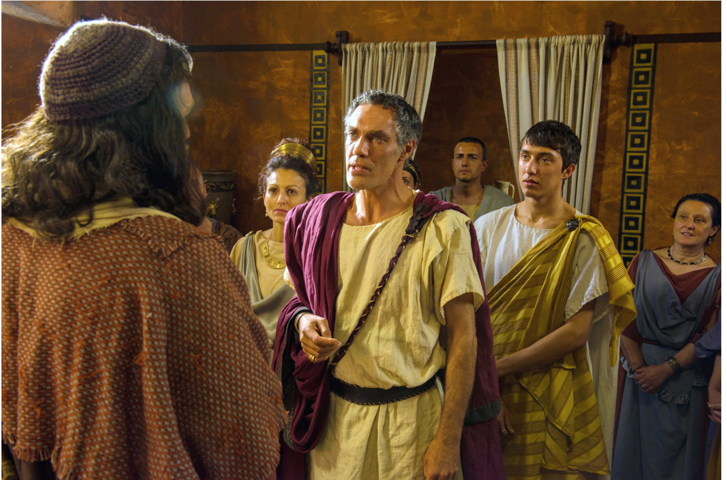
Handelingen 10 : 24: En Cornelius verwachtte hen, samengeroepen hebbende die van zijn maagschap en bijzonderste vrienden.