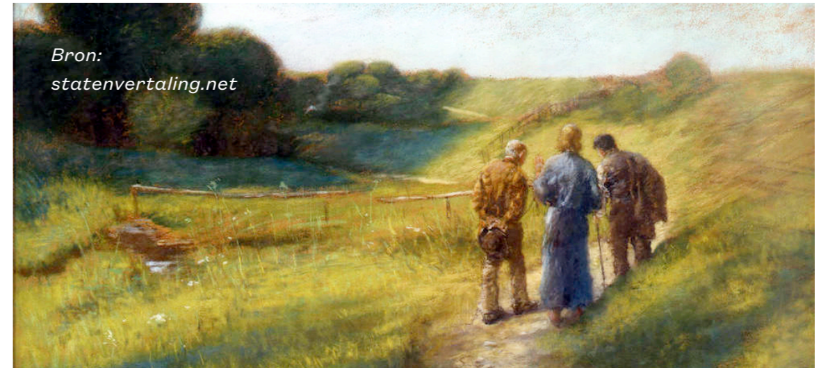
Schilderij van Fritz Von Uhde (1848 - 1911). Hij had de gewoonte bijbelse taferelen te plaatsen in een eigentijdse boerse omgeving.

En Hij zeide tot hen: O onverstandigen en tragen van hart, om te geloven al hetgeen de profeten gesproken hebben!