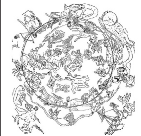
Zie bijbelstudie nr. 21: "Christus in de sterren".

Het hele verhaal van de Argonauten is een verbastering van de oude overlevering, vanaf Adam, omtrent Christus, omtrent de Verlosser, Die komen zou. De plaatjes daarvan vinden we aan de sterrenhemel, d.w.z. de klassieke sterrenkaart, die van Dendra. Daar komen we inderdaad de tweelingen ook tegen. Het is een van de tekens van de dierenriem zelfs. Een van de twaalf tekens van de dierenriem. De tweelingen. De "Argos" komen we ook tegen. Het hoort niet bij de dierenriem, maar is er, zoals alle beelden, aan gerelateerd. Het grote schip helemaal in het zuiden ergens.