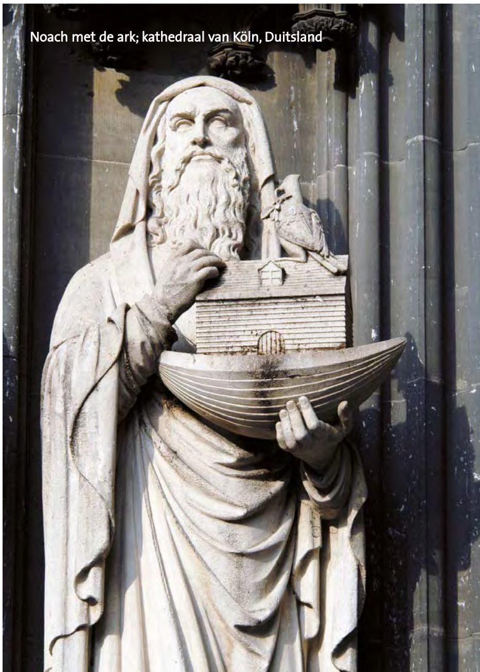
Noach met de ark; kathedraal van Köln, Duitsland